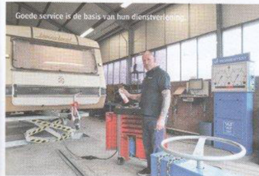
Goede service is de basis van hun dienstverlening.