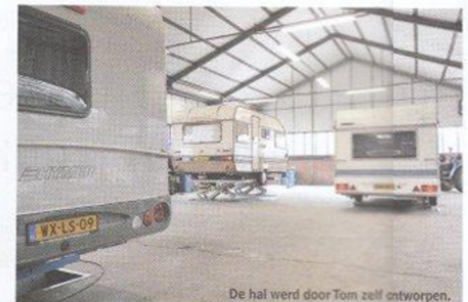
De hal werd door Tom zelf ontworpen.