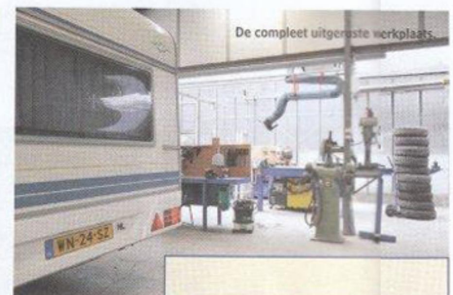
De compleet uitgeruste werkplaats.

de stallingrelaties en hen gevraagd naar hun wensen. Deze wensen werden meegenomen in de uitvoering. De hallen bieden plaats aan 1500 caravans. Daarmee heeft Van Vliet de grootste caravanstalling van Nederland en wellicht zelfs in Europa. Als extra service beschikken de klanten over een speciale toegangspas, waarmee ze dagelijks tussen 06.00 uur en 23.00 uur hun caravan kunnen ophalen en terugbrengen. "Dat de klant tevreden is, blijkt uit de lange wachtlisjt van gemiddeld anderhalf tot zelfs vier jaar", aldus Brenda. Naast de stalling biedt van Vliet een goed geoutilleerde werkplaats voor alle werkzaamheden.